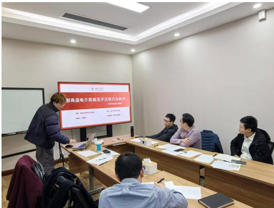
图 4 开题答辩现场四