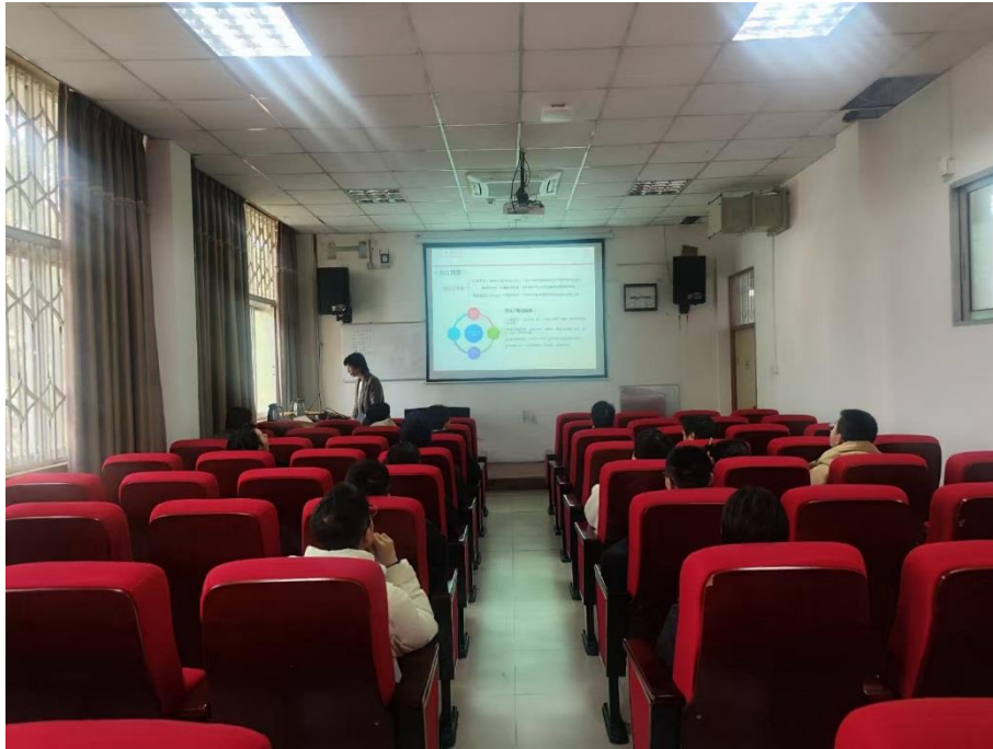
图 1 开题答辩现场一