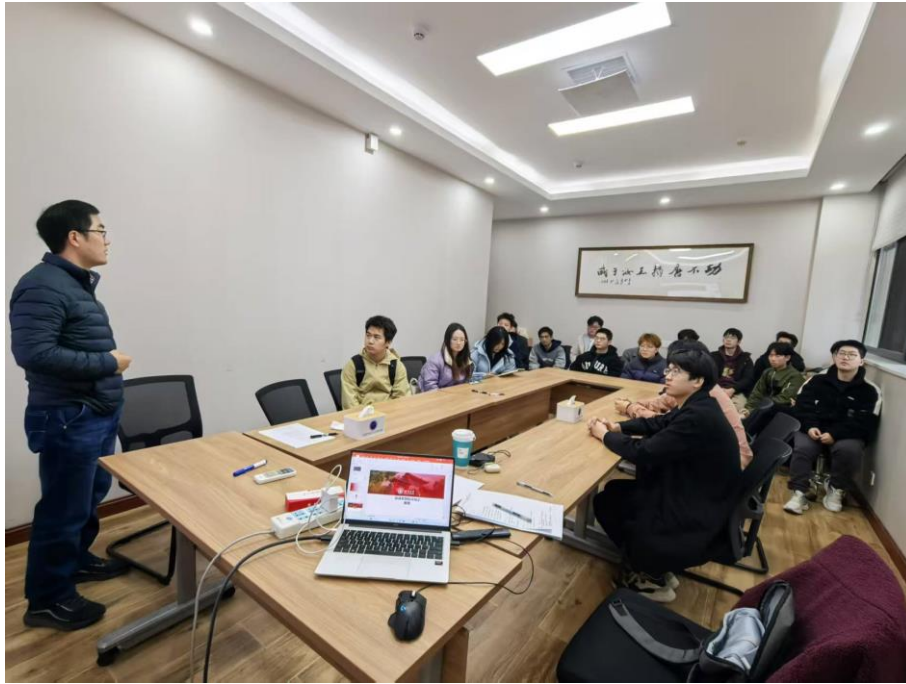
图 3 开题答辩现场三