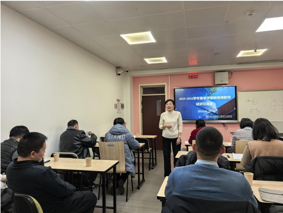
图 5. 督导组参加青年教师试讲