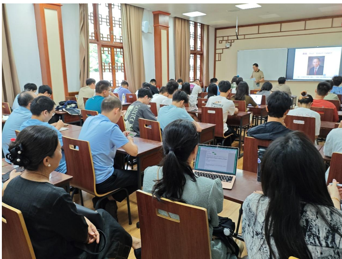
图 3. 督导组参加教学观摩