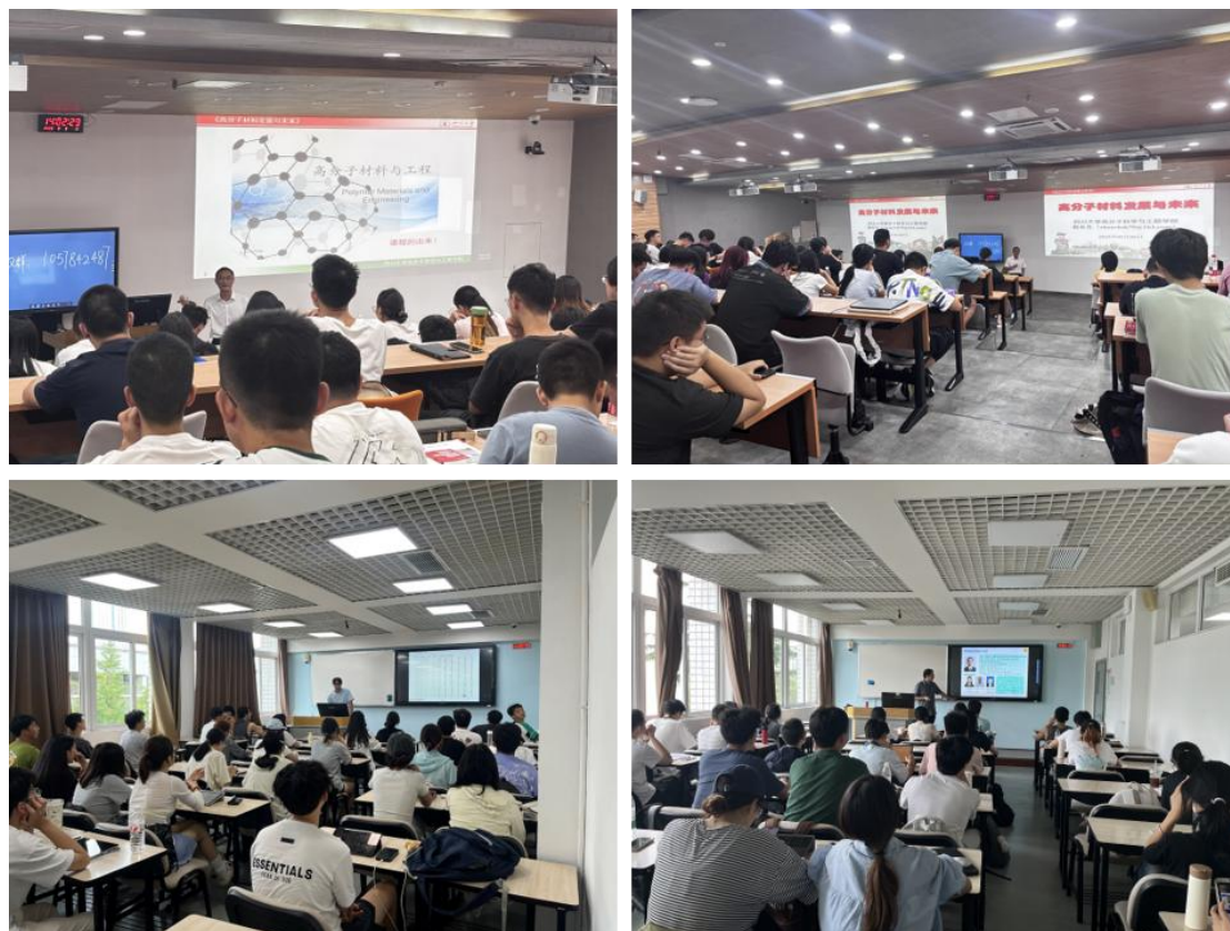
图 1. 督导组参加教学检查和听课