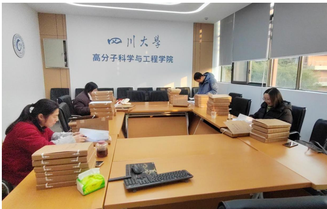
图 2. 督导组参加试卷专项检查